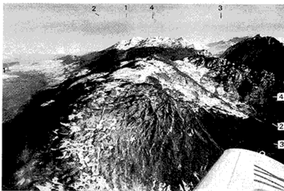
Fig. 2. — Vue générale (vers le NE) du versant sud du plateau de Fau-Laurent, prise à l'aplomb de la Romanche entre Séchilienne et le Péage-de-Vizille.

A gauche : dépression d'Uriage (Aalénien). Au fond : Belledonne (en face) et les Grandes Rousses (à droite).