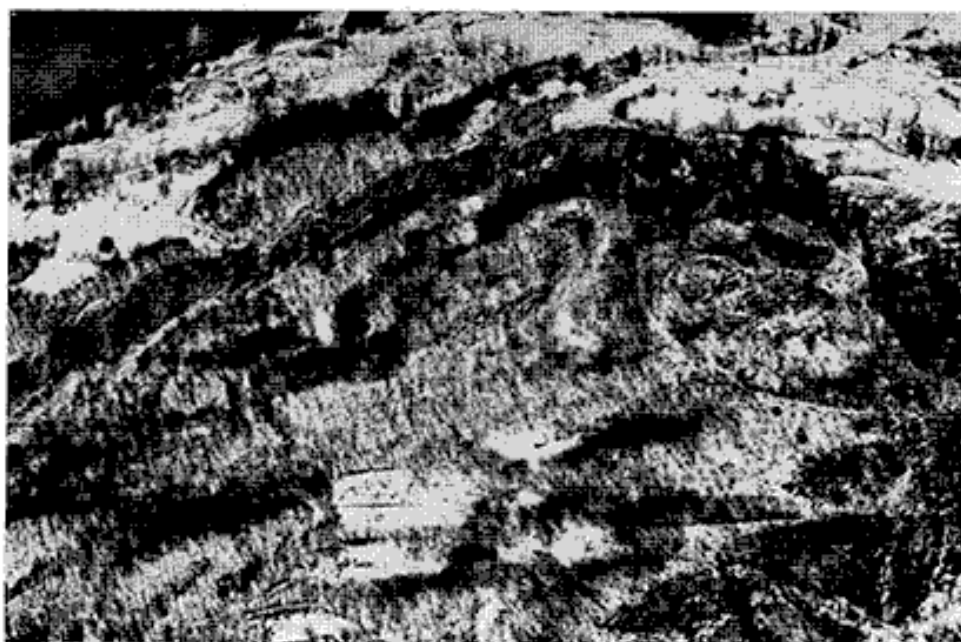
Fig. 3. — Détail de la fig. 2 : Vue rapprochée du sommet du tassement de Mont-Sec.

Le plateau de Mont-Sec est limité au S par une falaise concave, verticale, d'une trentaine de mètres de haut et dominant un replat assez vaste (fig. 3). Il s'agit à l'évidence de la crevasse supérieure, en cours d'ouverture, d'une niche d'arrachement très spectaculaire qui correspond au départ récent d'une zone tassée. Dans la pente,